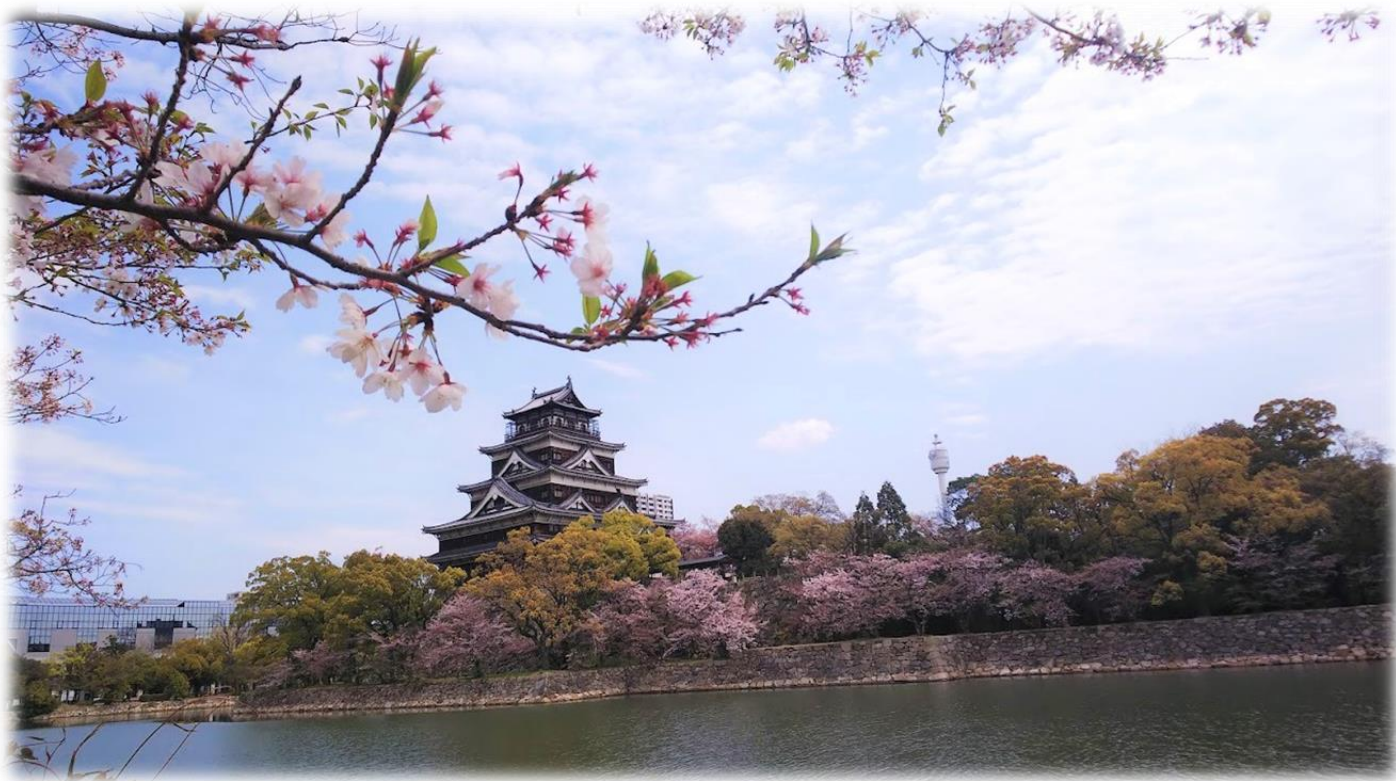
#桜散り始め #新緑 #静かな日曜日の朝 #広島城