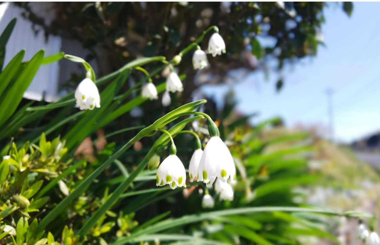
#スノーflake (すずらん水仙) #新緑